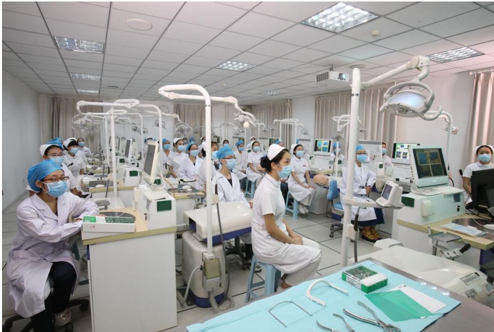
同学们在教学仿真头模上进行操作训练

医院选拔业务精湛，师德高尚的优秀教师脱产承担本科生的实习带教任务，建章立制，保证病源的种类与数量，为实践教学质量提供有力保障。