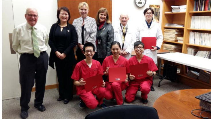
师生们与美国内华达大学牙科学院领导、老师合影